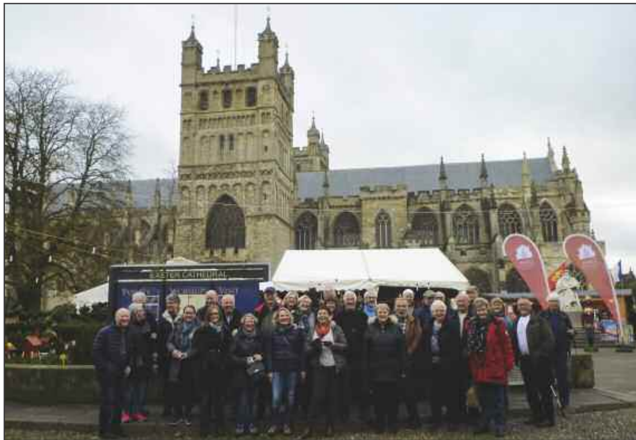
Domkirken i Exeter