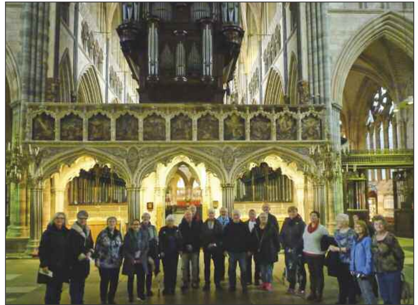
I Exeter domkirke. Det var artig å synge i en stor katedral.

Det hev ein viskar sprunge Ut av ein buss so skral Det er godt at me er unge Det sparar oss for mykje tral No set me her og glor Kven er det som er ramma? Det er vårt kjære kirkekor!