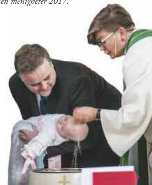
Dåpsvannet gir oss nytt liv.