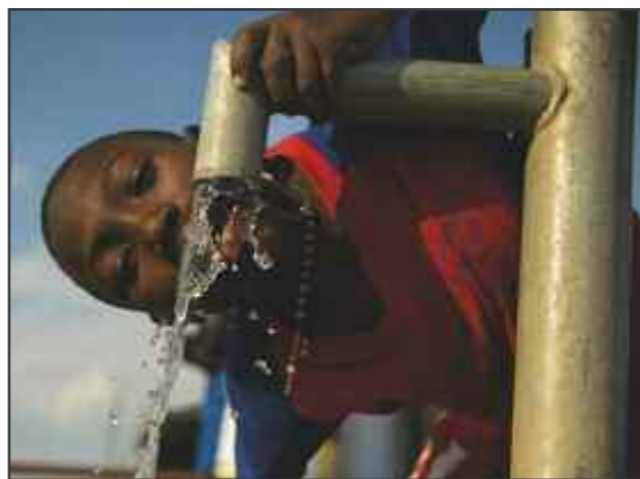
Fra Fet og Dalen menigheter ble med i faste-aksjonen i 1998 og fram til 2016, har vi vært med på å gi 4339 mennesker rent vann resten av livet deres.

Filmene var vakker. Den var vakker fordi jeg fikk et innblikk i andres harde liv, som er helt ulikt mitt. Filmene gjorde meg mer bevisst på hvor heldig jeg er som lever så bra som jeg gjør i dag. Mennesker som er på flukt er helt like mennesker som deg og meg. De er like verdifulle