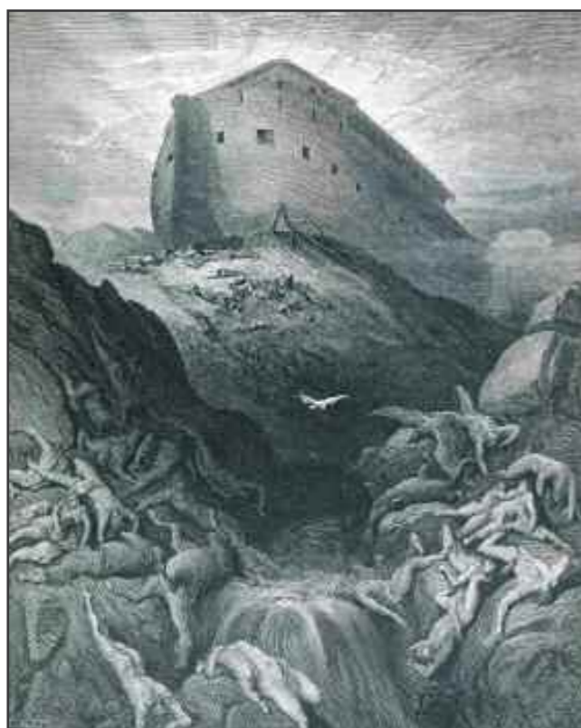
„Duen utsendt fra Noas ark” av Gustave Doré 1866

Konfirmantene leser fortellingen om Noas ark og vi snakker sammen. Gud er trist. Alt han hadde skapt er ødelagt av menneskene. Kanskje ikke helt ulikt deler av verden i dag. Gud bestemmer seg for å gjøre noe. Han vil «vaske» bort alt han har skapt og begynne på nytt.