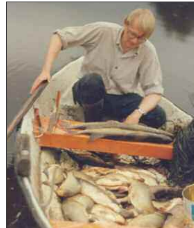
«Har'u fiske så fælt 'a...».

I november-desember kommer stimer av sik opp fra Øyerens store dyp. De samler seg for å gyte på grunnene ved den øverste øya i deltaet, Gjushaugsand, 8-9 hundre meter nedenfor Våtmarkssenteret. Dette tradisjonsrike garnfiske er det nesten ingen som holder i hevd lenger. Men for meg er det en særegen sjarm å ro ut mens lensestokkene ligger der hvite av snø og kulda biter litt i kinnet. Garnet trekkes ikke opp hver dag, man bare drar ut for å se etter det og plukker ut fisken. Det heter på vakker lokal dialekt «å vekja gån». Når man har nok fisk – gjerne etter en ukes tid – tar man garnet opp. Før kunne det bli 70-80 fisk på ei uke, i seinere år adskillig mindre. Men størrelsen er blitt bedre enn før, med snitt på ca. halvkioloet. Akvariet på lensemuseet ønsker seg levende sik. Jeg har levert noen eksemplarer, men de har hittil ikke overlevd. Siken smaker tamt i seg selv. Den bør røykes eller graves. Varmrøkt sik som fortæres med det samme er en rein delikatesse, med sennepsaus.