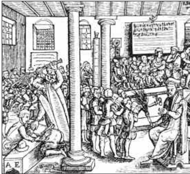
Skolen på 1500-tallet var ikke som i dag.

I år er det 500 år siden vår kirke ble skilt ut fra Den katolske. I den anledning vil Menighetsbladet forsøke å belyse noe av det som skjedde. Det gjør vi med fem små artikler: