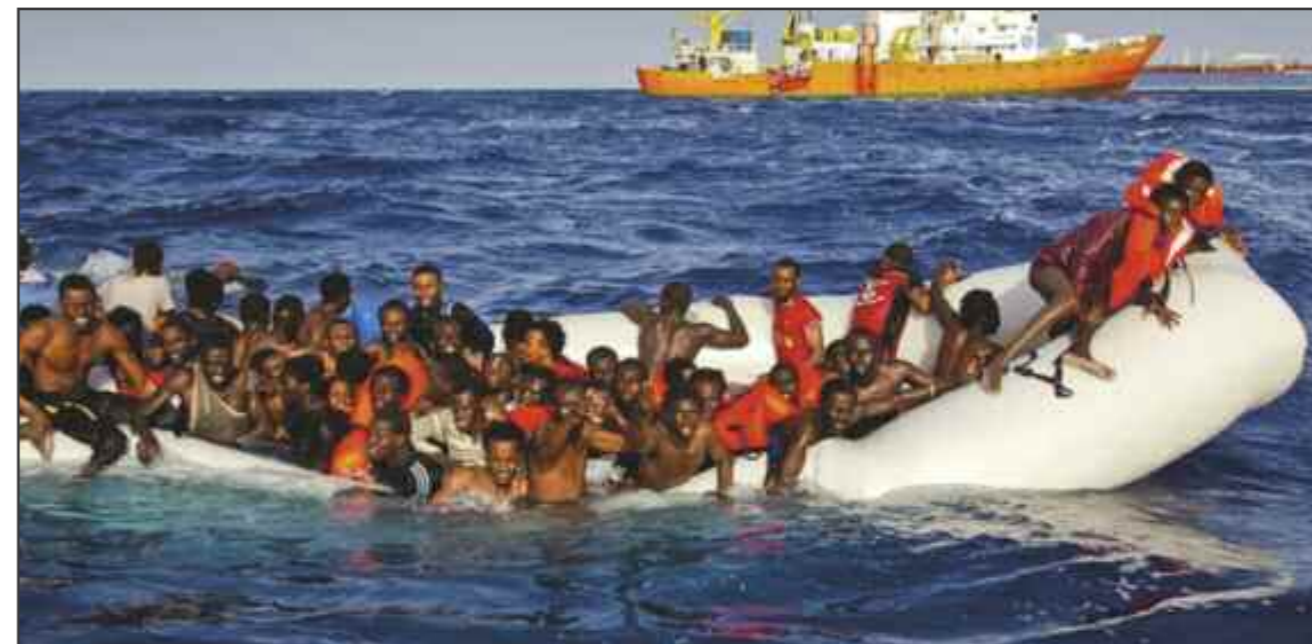
11000 menneskene har druknet i Middelhavet de siste tre årene. 11000 som er helt like mennesker som deg og meg.

som oss, og de har de samme egenskapene som oss. De fortjener å ha det like bra som alle oss andre her på jorda.