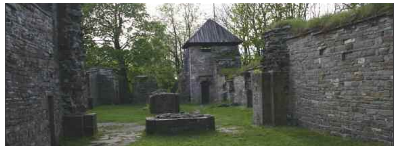
Klosteret på Hovedøya eide det aller meste av jordbruksjorda i Østfold, Vestfold, Buskerud og Akershus.