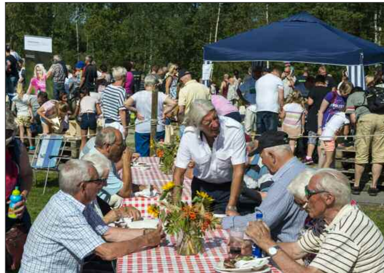
Vi har mange gode tradisjoner i bygda som kan bidra til lykke for oss. Her fra Sakuendagen 2015.

Mange har undret seg over dette bibelstedet. Men tilhørerne som hørte Jesus si dette, forstod hva han mente. Jesus trekker på tankegods fra Det gamle testamente, som tilhørerne kjente igjen. I 1978 oversettelsen har man valgt å oversette dette verset slik: "Salig er de som er fattig i seg selv." Dette er et sterkt ord som betyr at man er ytterst fattig og i nød. Jesus bruker meget sterke ord i Bergprekenen, og dette er det første eksemplet. En jøde som hørte på Jesus ville forstå at Jesus mente ikke bare materiell, men også åndelig fattigdom. Derfor har noen valgt å bruke "fattig i ånden" i oversettelsen, som er en ordrett oversettelse fra originalteksten. Men hva betyr dette? En som er fattig i ånden er en som ikke stoler på sine egne ressurser, men setter hele sin lit til Gud for hjelp. I Det gamle testamente er ordet "fattig" ofte brukt symbolsk for den ydmyke og hjelpeløse som setter sin lit til Guds hjelp. De erkjenner at Gud er løsningen på deres problemer og utfordringer. De tror nemlig at Gud er interessert i og vil hjelpe dem. Derfor er de trygge og glade.