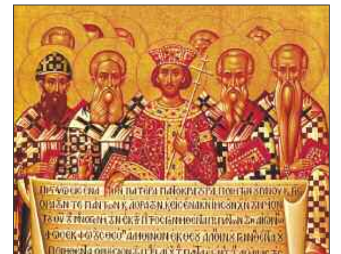
Ikon som framstiller Konstantin og biskopene ved konsilet i Nikea som holder opp den nikenske trosbekjennelse