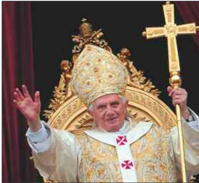
Paven er valgt for å videreføre Peters plass i kirken

I år er det 500 år siden vår kirke ble skilt ut fra Den katolske. I den anledning vil Menighetsbladet forsøke å belyse noe av det som skjedde. Det gjør vi med fem små artikler: