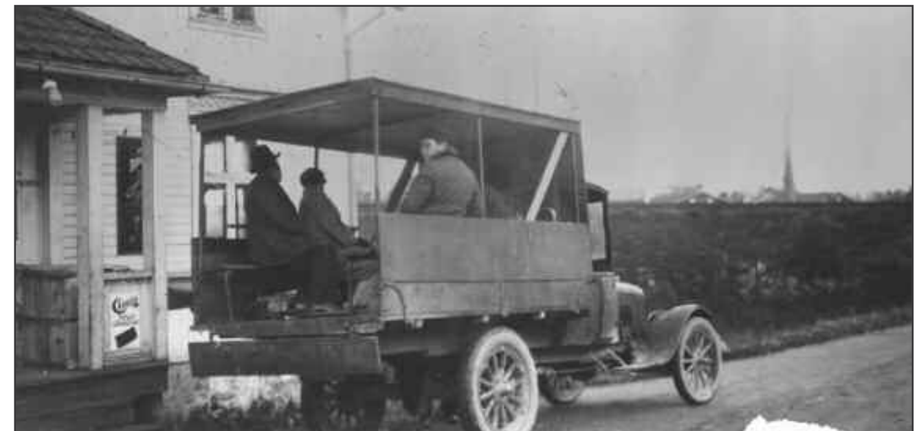
Bildet tatt ca 1924 av den første rutebilen mellom Lillestrøm og Rælingen.

Herredstyret i Fet vedtok i 1925 å søke om deling med 22 mot 2 stemmer. Representantene fra Fet herred hadde flertallet i herredstyret og kunne, om man hadde ønsket, ha stoppet saken. Motstanden mot delingen kom derimot fra Rælingen. I en uttalelse til delingen fra