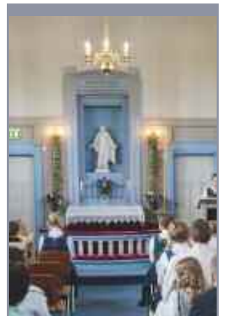
Dalen kirke jubilerer

Fet hagelag er arrangør. Mer info på hjemmesiden deres.