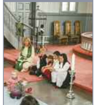
Babyer og barn i Fet Kirke