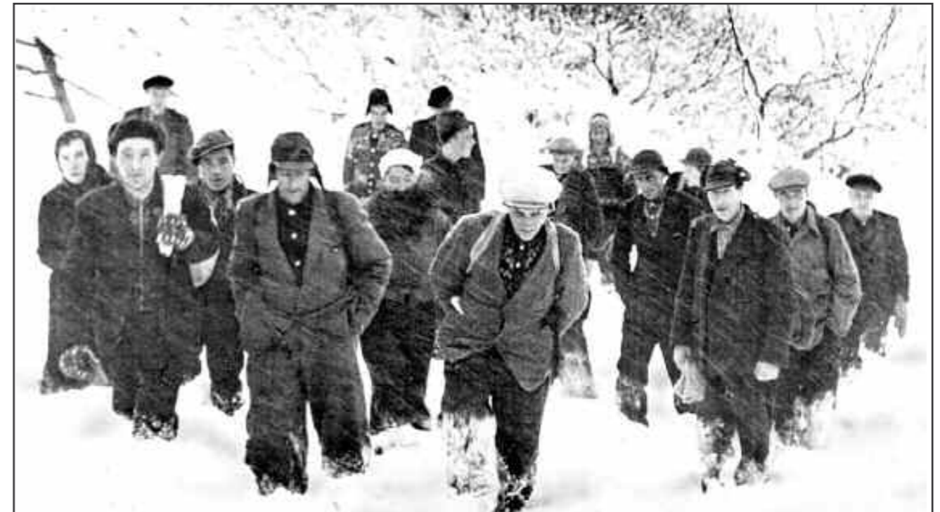
Mange nordmenn flyktet til Sverige under 2. verdenskrig. I dag kommer det flyktninger fra andre kriger til oss. Hvordan tar vi imot dem?

Alt dere vil at menneskene skal gjøre mot dere, gjør det også mot dem