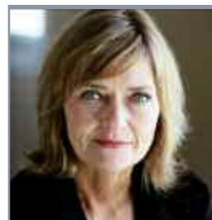
NRK-journalist og forfatter Sigrun Slapgard