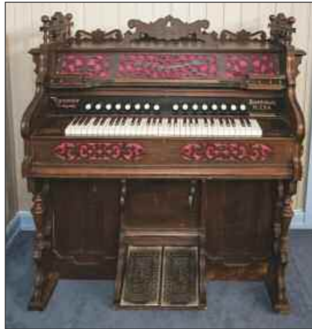
Pumpeorgelet fra 1905

Barnas Bål bygger på en legende hvor høvdingene besluttet at ingen skulle foreta handlinger som kunne skade barnas livsgrunnlag i syv generasjoner fremover. Med utspring i legenden tar vi ungdommene med på en