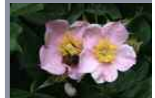
Riktig plante på rett plass.