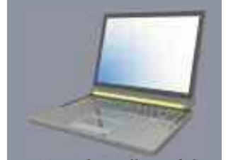
Ta med PC eller mobil