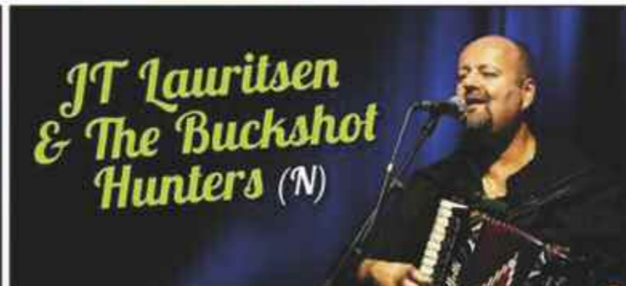
JT Lauritsen & The Buckshot Hunters (N)