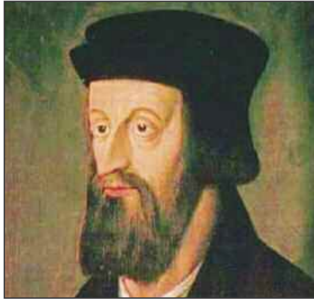
Jan Hus fikk stor tilslutning til sine nye måter å forstå skriften på

I år er det 500 år siden vår kirke ble skilt ut fra Den katolske. I den anledning vil Menighetsbladet forsøke å belyse noe av det som skjedde. Det gjør vi med fem små artikler: