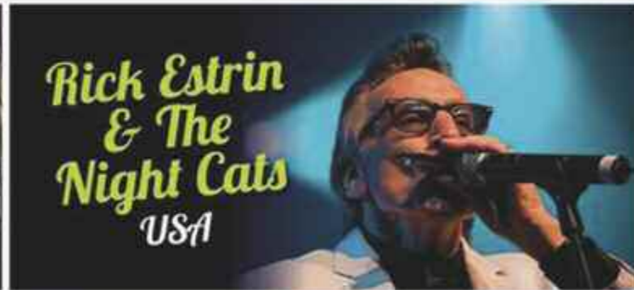
Rick Estrin & The Night Cats USA