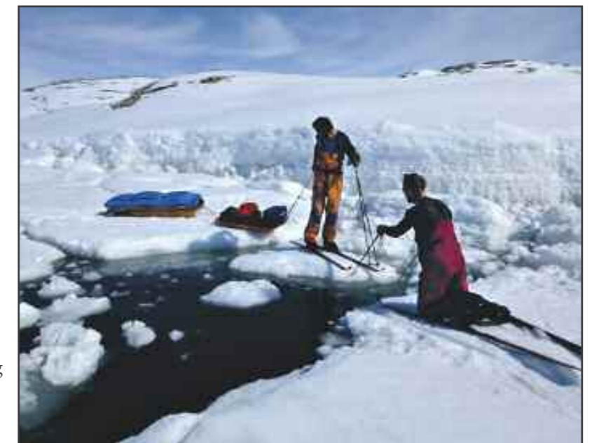
Siste dagen over fordisen haster det med å komme fram før den sprekker opp

- De første fire dagene var skikkelig krevende. Vi fikk ikke gått på ski, men måtte dra all bagasjen opp og ned