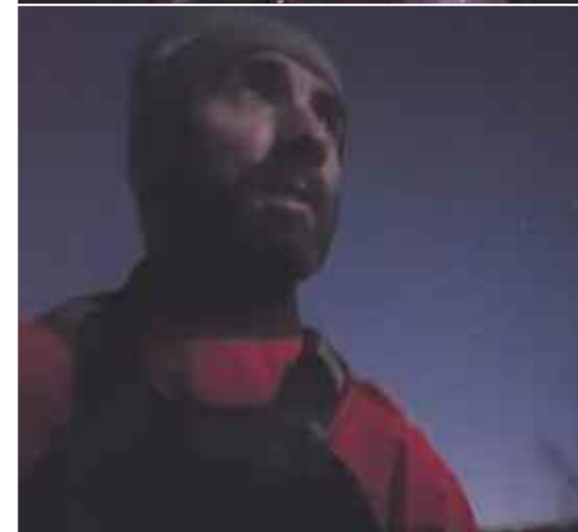
Trolsk stemning på vannet.