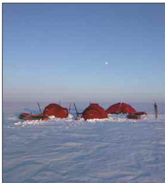
Måne over leirplassen