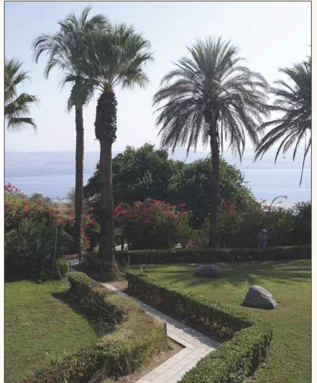
Genesaretsjøen: Her holdt Jesus en av sine mest kjente prekenen, Bergprekenen