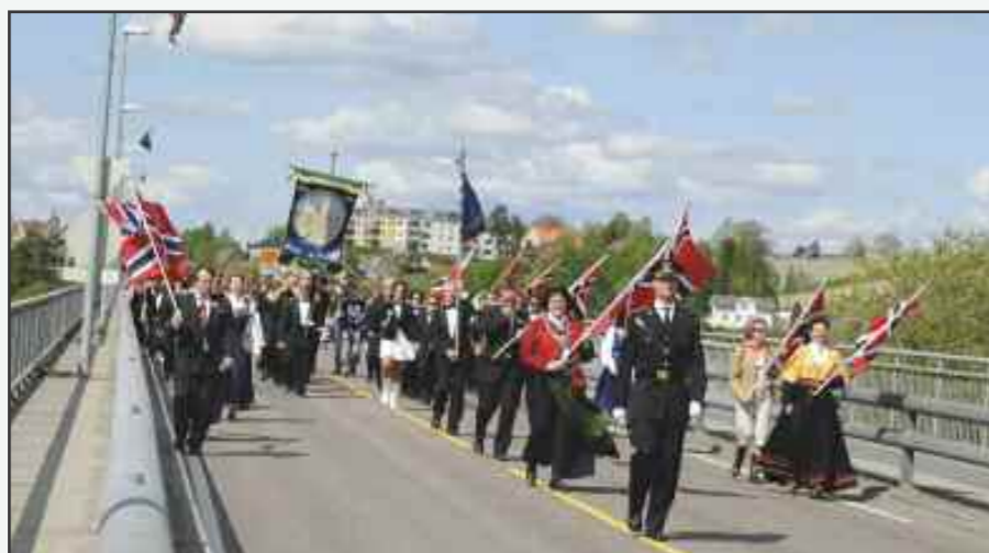
Skal 17.mai toget i fremtiden fortsette å gå over brua?

Programmet for 17. mai vil distribueres til alle husstander i Fet.