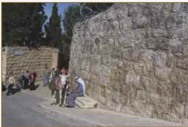
Ned fra Oljeberget

Når jeg står på Oljeberget i dag, ser jeg den samme utsikten, men Tempelet er ikke lenger der. Nede ved foten av Oljeberget skimter jeg Getsemane som en hage full av oliventrær. Jeg ser Kedrondalen og til venstre ser jeg opp på Nattverdsalen som ligger på Sionsberget. Når jeg vender blikket til høyre, ser jeg Pilatusborgen. Tvers over tempelplassen ligger Golgata der Jesus ble korsfestet og gravlagt.