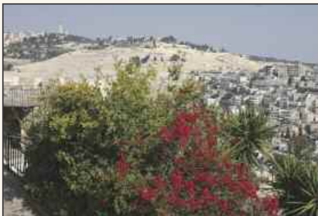
Jerusalem er kontrastfylt, historisk og vakker.

Bare en kort biltur unna finner vi Brødunderets kirke hvor vi får høre den velkjente historien om hvordan Jesus mettet de 5000 med 5 brød og to fisker. Kirken er bygget på stedet der hvor forskere mener at Jesus først velsignet maten før han ba disiplene om å dele den ut. Historien i området er til å ta og føle på og det virker