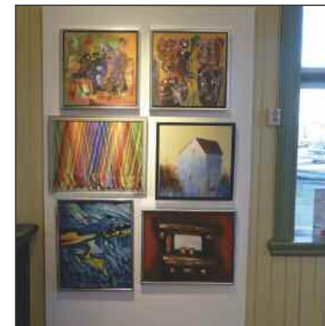
Galleriet var fullt av flotte arbeider. Her en av veggene