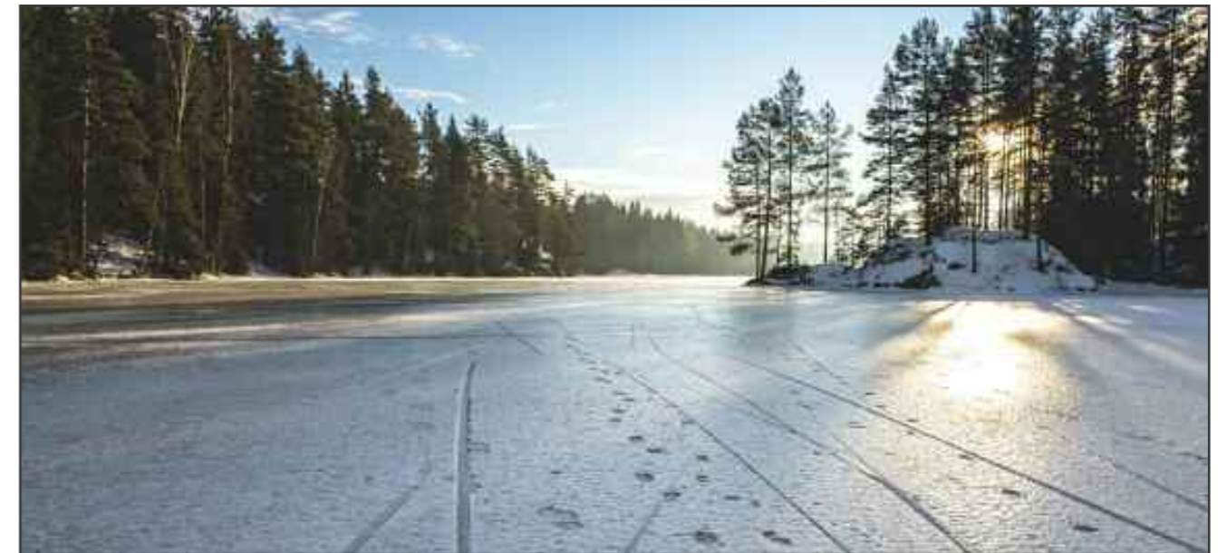
På veg mot skihytta: sol over Hvalstjern