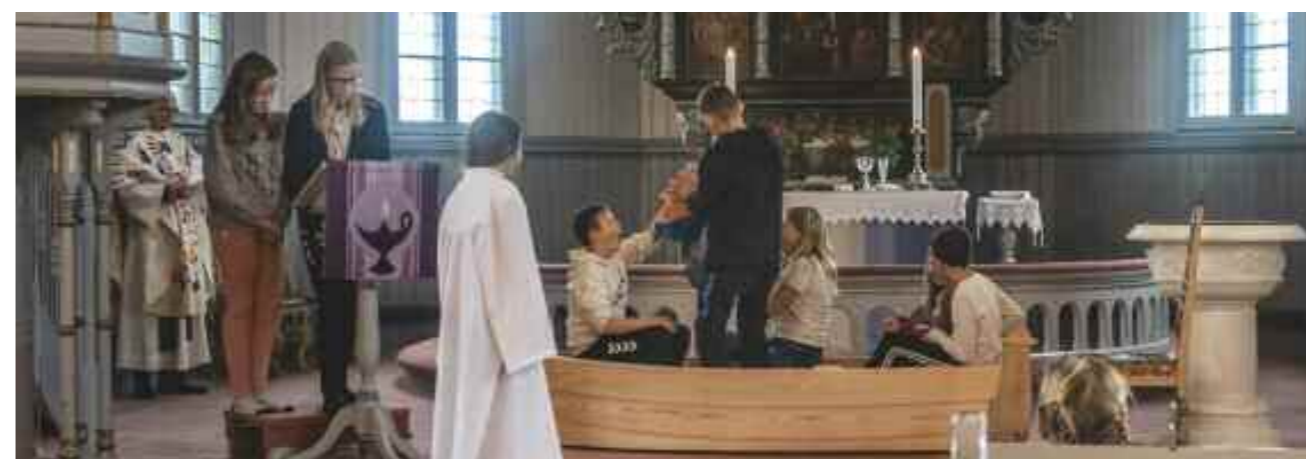
Konfirmantene deltok under gudstjenesten på søndag