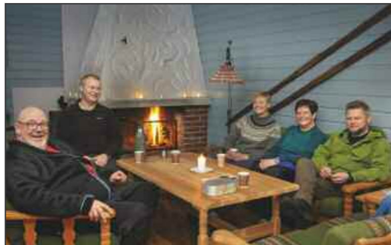
Styret samlet i den trivelige peiskroken på hytta