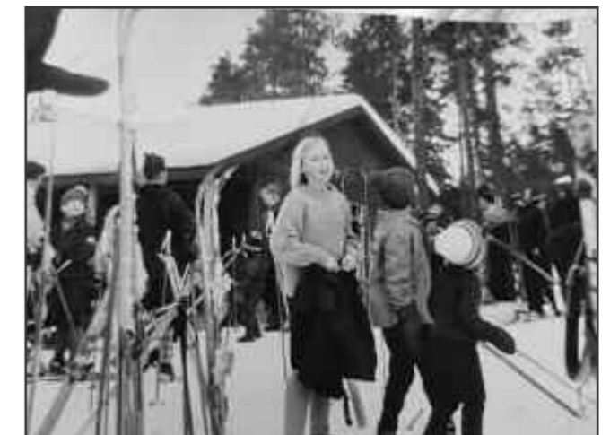
Skihytta en fin vinterdag ca 1960